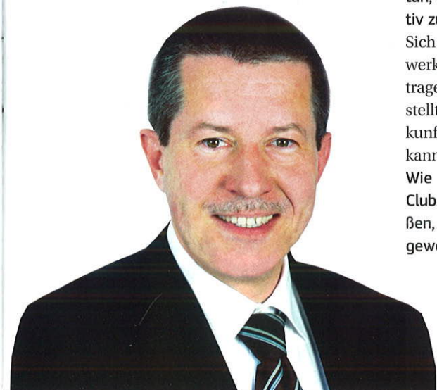
Christian Goiny ist Medienpolitischer Sprecher der CDU-Fraktion im Berliner Abgeordnetenhaus